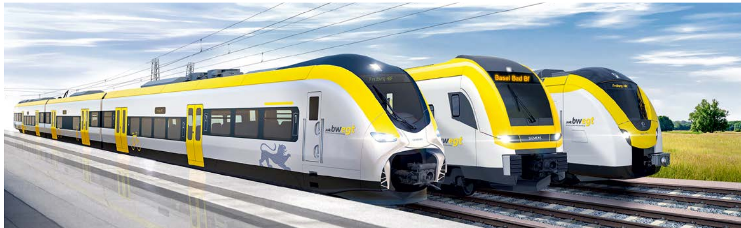
3D-Rendering von drei weiteren Zugtypen, die in Baden-Württemberg zum Einsatz kommen werden: Mireo, Desiro von Siemens und Coradia von Alstom

Die neuen EVU gehen mit neuen hochmodernen Zügen renommierter Hersteller mit weltweiter Expertise an den Start. Je nach Los handelt es sich dabei um drei- bis sechsteilige Züge des Typs „Flirt“ von Stadler (Lose 2 und 3) oder des Typs „Talent 2“ von Bombardier. Beide können bis zu 329 Sitzplätze bieten und treten unabhängig vom EVU im neuen einheitlichen „bwegt“ Landesdesign an.